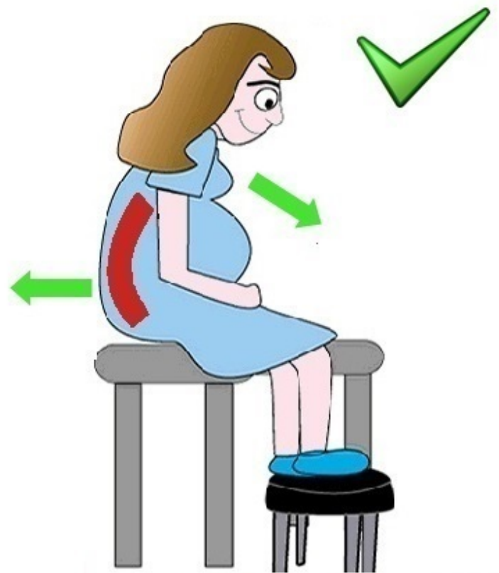
Sturmev, Chambers & McNamara